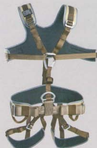
【フルボディーハーネス】 レンジャーハーネスとレンジャーチェストハーネス の組み合わせ例