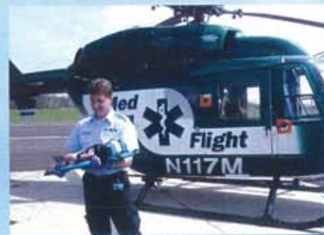
ヘリコプター輸送