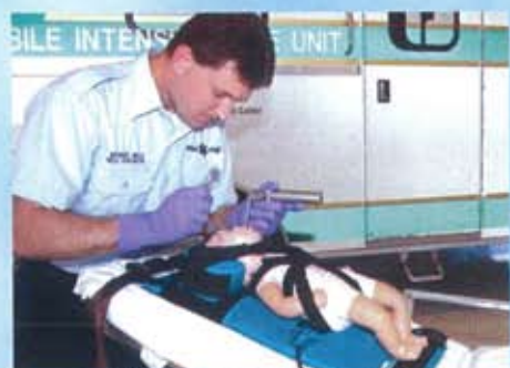
気道確保が行い易くなります