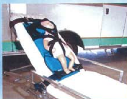
ストレッチャーとの併用