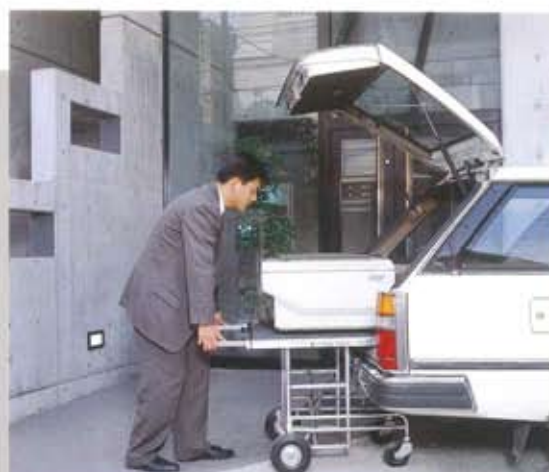
組み立て時に、床の高さに合わせる事が出来ます。