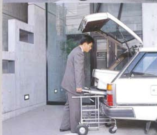
テーブルをスライドさせて搬入します。