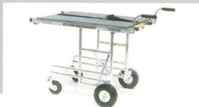
モデル288（オプションのハンドルキット付）