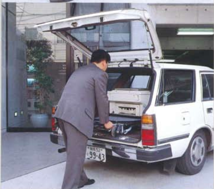
レッグリリース機構により、搬入、搬出を一人で行う事ができます。