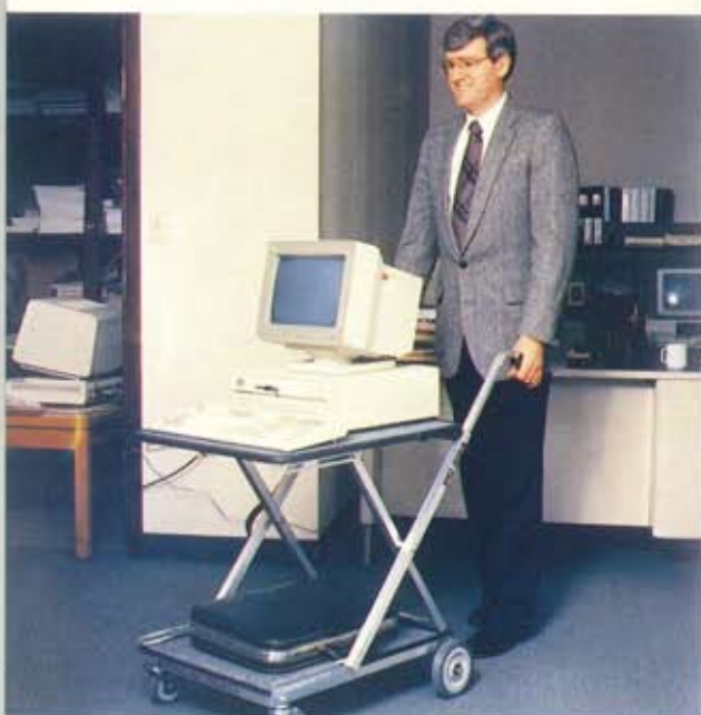
移動性は大変優れています。