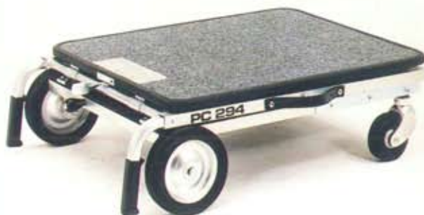
折り畳んで収納できます。