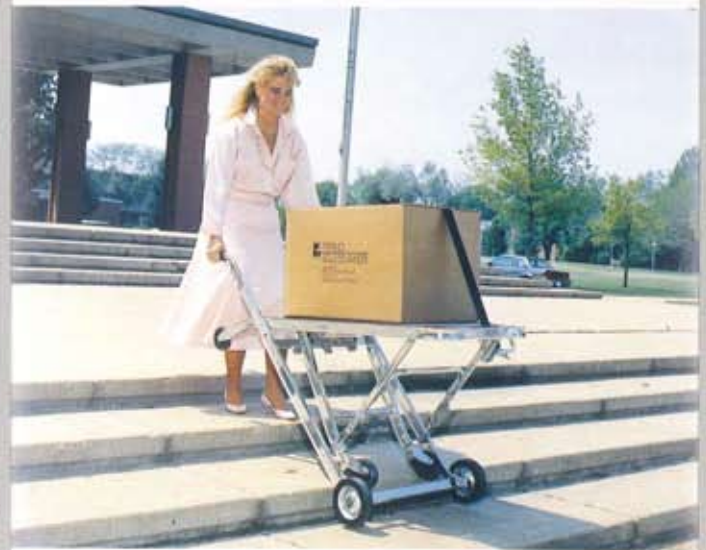
段差を容易にクリアーする事ができます。