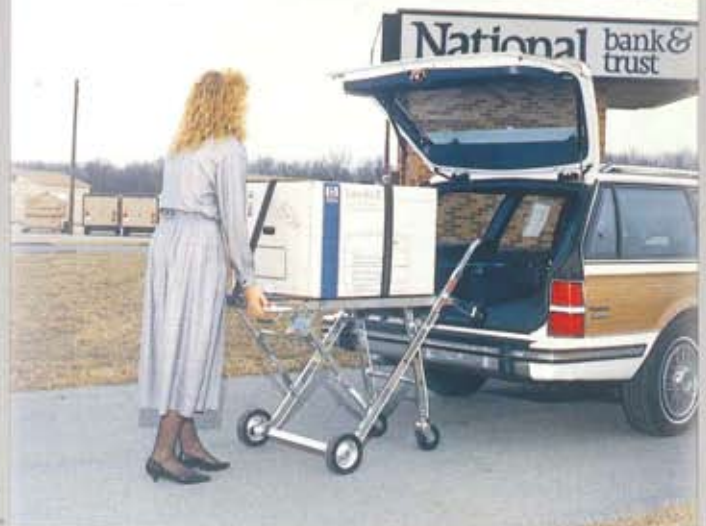
搬出入が一人で容易に行えます。