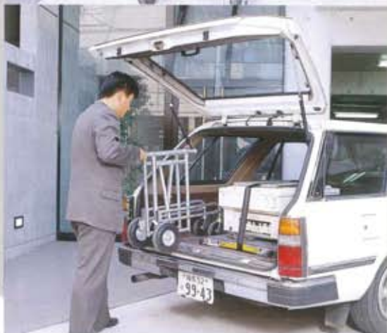
アンダーキャリッジは折り畳んで収納できます。